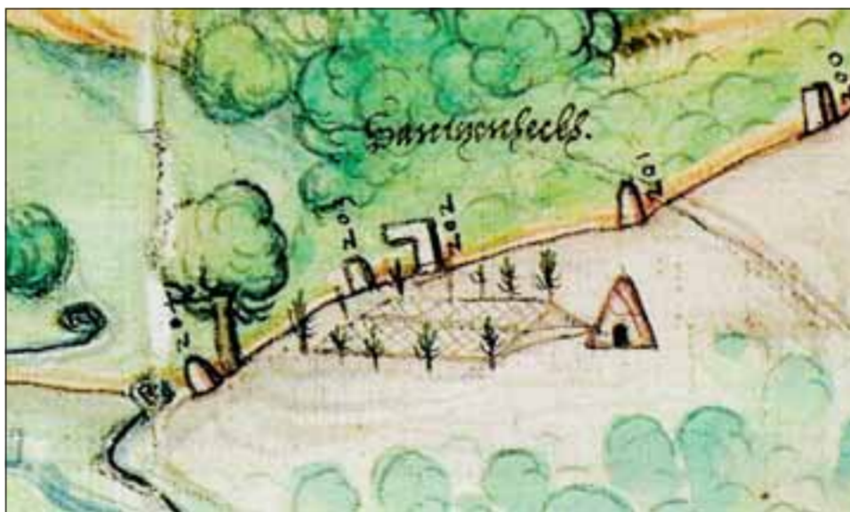
Ein Vogelherd bei Buchen mit Schlagnetzen und Hütte für den Vogelfänger (Ausschnitt aus einer archivarischen Karte von 1595 im Generallandesarchiv Karlsruhe).

Bibliographische Angaben über neue Odenwald-Literatur und Hinweise auf die diesjährige Frühjahrstagung des Breuberg-Bundes in Lautertal-Reichenbach bzw. am Felsenmeer am 30. Mai und die große Herbsttagung in Breuberg-Neustadt vom 24. bis 26. September beschließen dieses Heft. Es ist über die Geschäftsstelle des Breuberg-Bundes, Ernst-Ludwig-Str. 2-4 oder den Buchhandel sowie über das Internet unter www.breuberg-bund.de zu beziehen, wo auch weitere Auskünfte zu erhalten sind.