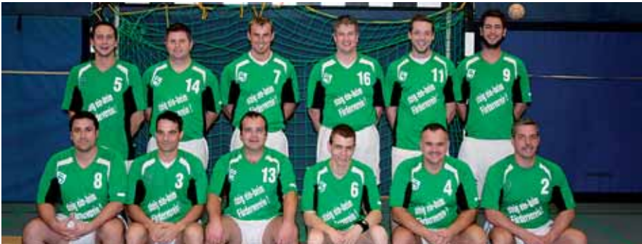
Die neue Dritte Mannschaft verbessert den Unterbau der Handballer.

Mosbach-Neckarelz · Hohlweg 18 · Tel.: 06261/675 83 -0