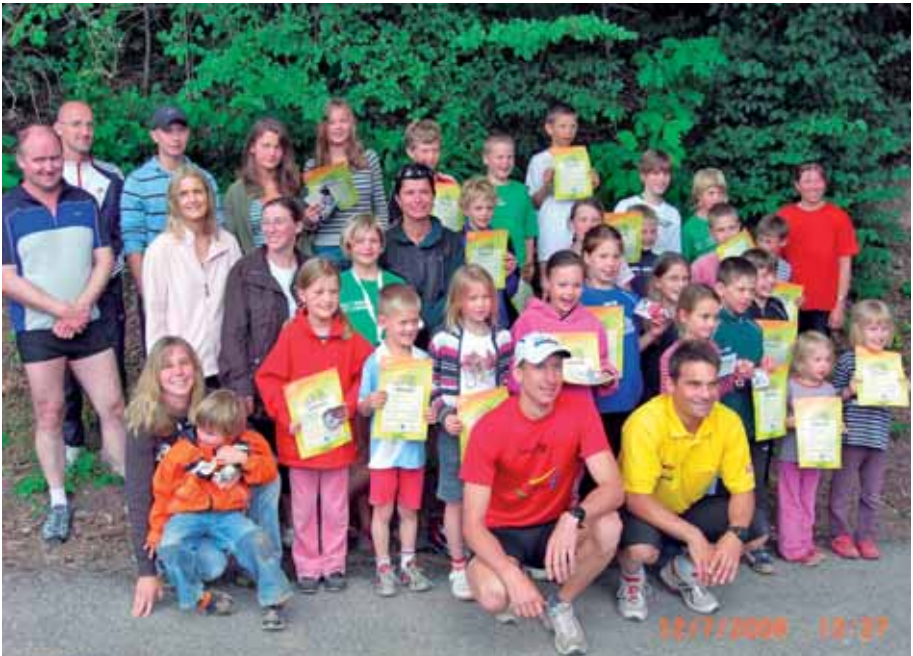
Ein Erfolg war der 2. Kinder- und Jugendtriathlon des TSV.

Bei gutem Wetter fand der zweite Kinder- und Jugendtriathlon des TSV Buchen im Waldschwimmbad statt. Nach einer Wettkampfbesprechung und der Ausgabe der Wettkampfstartnummern, der Aufkleber und der Kennzeichnung am Oberarm ging es für die 55 jungen Teilnehmer in den frühen Morgenstunden an den Start.