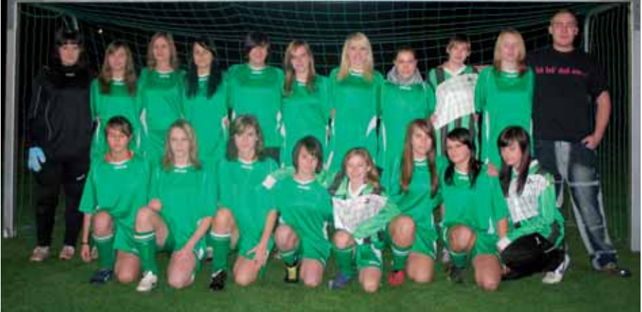
Die Mädchen des TSV Buchen verbessern sich kontinuierlich und konnten auch schon einige Siege einfahren.