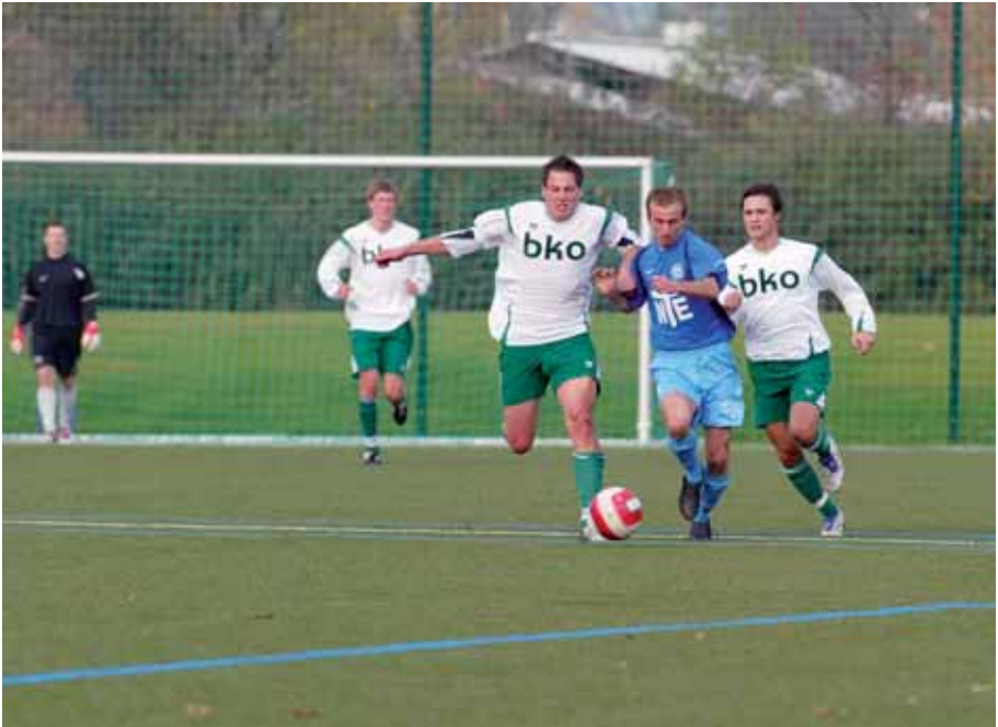
Immer einen Schritt schneller waren die TSV-Kicker in der Verbandsligapartie in Kirchheim. Am Schluss siegte der TSV Buchen mit 7:3.

Bevor ich auf die momentane Tabellensituation komme, die zugegebenermaßen noch sehr ausbaufähig ist, möchte ich einige grundsätzliche Bemerkungen vorausschicken. Allen Insidern, insbesondere natürlich auch der Mannschaft selbst als den Hauptbetroffenen, war klar, dass man sich auf eine äußerst schwierige Aufgabe eingelassen hatte. Der Sprung von der Landesliga Odenwald in die Verbandsliga Nordbaden ist enorm und ohne teure Spielerverpflichtungen nur mit eigenen Spielern eigentlich gar nicht machbar. Die finanziellen Voraussetzungen im Vergleich mit den anderen Mannschaften sind zu unterschiedlich. So hat zum Beispiel Ligakonkurrent Friedrichstal einen Kader von 28 Spielern, davon zwölf Neuverpflichtungen von allen möglichen Vereinen, die natürlich nicht nur wegen der guten Friedrichstaler Luft gekommen sind. Bei anderen Vereinen ist es ähnlich.