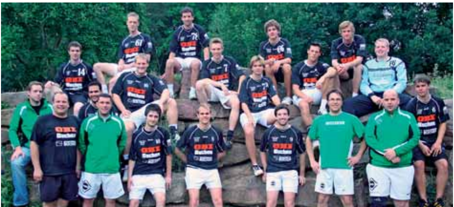
Für die 1. Handballmannschaft des TSV (Bild) beginnt jetzt der heiße Herbst in der Landesliga Odenwald.