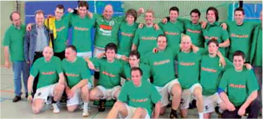
Die 2. Mannschaft möchte nach dem Aufstieg auch in der Kreisliga B oben mitspielen.

wird man sehen können, wohin sich sein Weg 2008/2009 entwickelt, doch die gemeinsam eingeschlagene Richtung zielt in die Richtung des erklärten Zieles, dauerhaft eine Spitzenmannschaft der Landesliga zu werden.