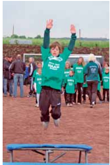
Die Jugendlichen zeigten beim Sportfest, was sie alles gelernt haben.