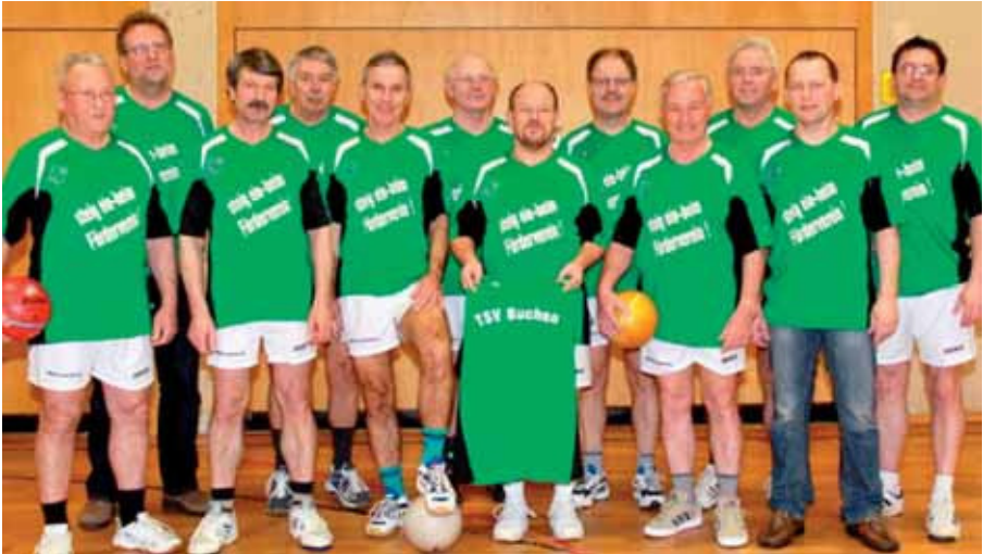
Die Prellballer in ihren neuen Trikots

Viele Buchener Turner führen wie jedes Jahr zum Deutschen Turnfest, das diesmal vom 20. Mai bis 5. Juni in Frankfurt stattfand. Ganz besonders gerüstet waren in diesem Jahr die Prellballer in der Altersstufe AK50 und AK60, die in dieser Klasse jeweils eine Mannschaft ins Rennen schickten. Der Förderverein des TSV Buchen hat die Prellballer dafür mit neuen Trikots ausgestattet.