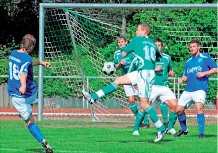
Die TSV-Kicker kämpften, aber gegen die starke Konkurrenz war wenig zu holen.