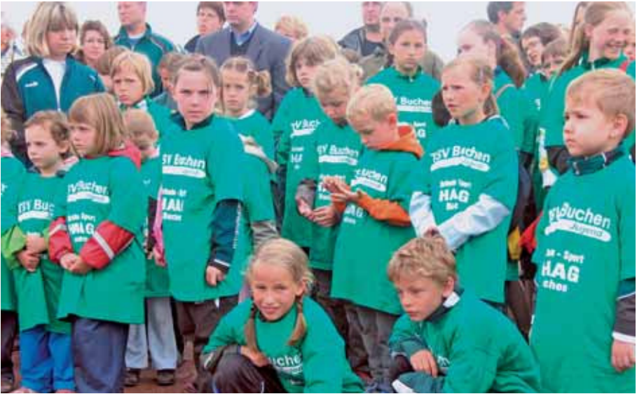
Die Jugendlichen des Vereins freuen sich in ihren neuen Trikots über die großzügige Spende der Dietmar-Hopp-Stiftung.