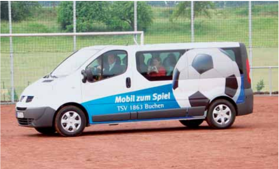
Das neue „Mobil zum Spiel“ bringt die TSV-Jugend künftig zu den Spielen.