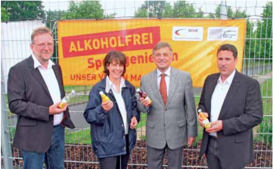
Die deutschlandweite Aktion „Sport ohne Alkohol“ beim Jugendsportfest des TSV kam prima an.