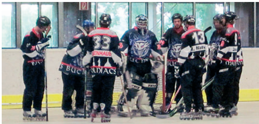
Teambesprechung vor dem kleinen Finale

Dort trafen die Maniacs auf Stutensee. Die Buchener waren in der Anfangszeit des Spiels überlegen, konnten aber kein Kapital daraus schla-