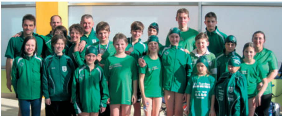
Der Nachwuchs der Sparte fühlt sich im nassen Element sehr wohl.