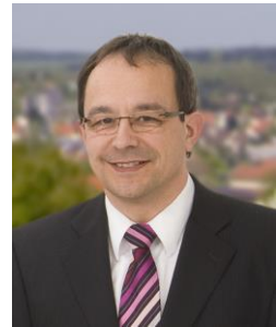
Bürgermeister Roland Burger

Die Sparte Triathlon des TSV Buchen ist am 06.Mai 2017 Ausrichter des 12. Buchener Triathlons, der wiederum in Verbindung mit dem „LBS-Nachwuchs-Cup“ und des Baden-Württembergischen Triathlon-Verbandes und dem 2.Neckar-Odenwald-Cup stattfindet. Die Vergabe dieser Triathlon-Wettkämpfe an den TSV ist deshalb auch eine besondere Anerkennung für das engagierte Team des ausrichtenden Vereins.