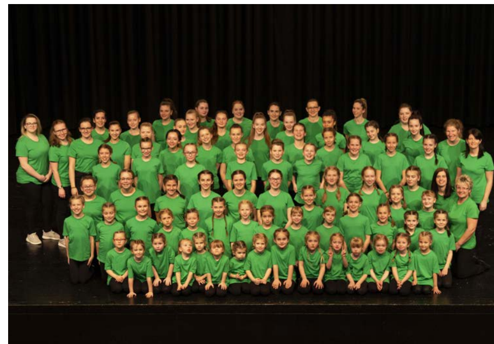
Schautanz beim TSV-Buchen

Zu Beginn jeder Trainingseinheit wird gewissenhaft aufgewärmt und auch der Muskelaufbau spielt dabei eine zentrale Rolle.