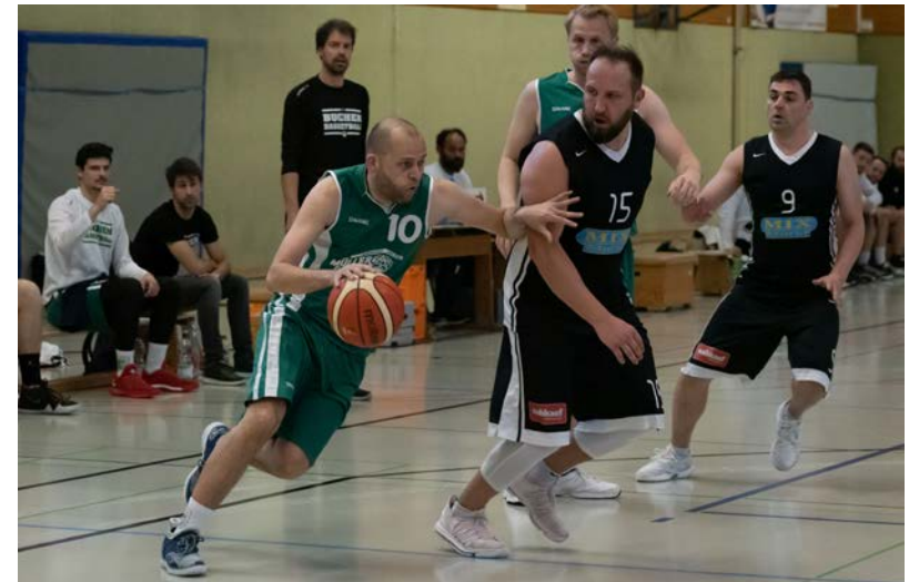
Trotz kämpferischer Leistung reichte es für die erste Herrenmannschaft am Ende in der Relegation um den Aufstieg in die Oberliga nicht ganz.