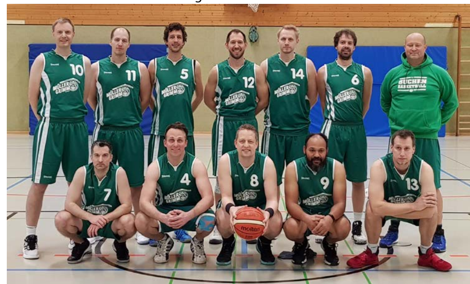
Team-Foto der Ü-35 bei den Baden-Württemberg-Meisterschaften in Buchen.

Hierzu konnte zum Beispiel die in Buchen ausgetragene Ü35-Baden-Württemberg-Meisterschaft beitragen, bei welcher in der vergangenen Saison der TSV Buchen erstmals in der Vereinsgeschichte selbst teilnahm. Zwar konnte man