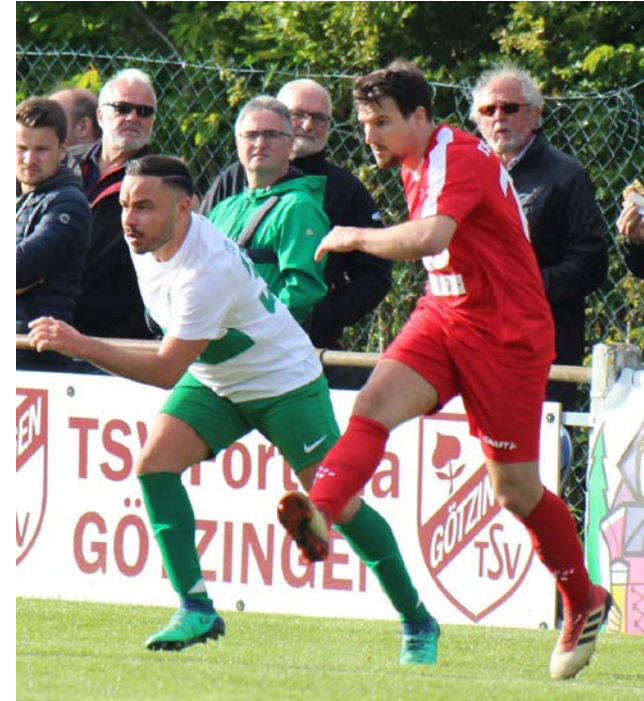
Der TSV Buchen im Pokalfinale gegen den Namensvetter aus Rosenberg.

Ähnlich unbefriedigend wie die Vorrunde verlief auch die Rückrunde. Geprägt von Personalmangel durch Sperren und Verletzungen, gepaart mit fehlender Cleverness und teilweise auch Pech im Abschluss, erreichte die erste Mannschaft das Ziel eines einstelligen Tabellenplatzes gerade so.