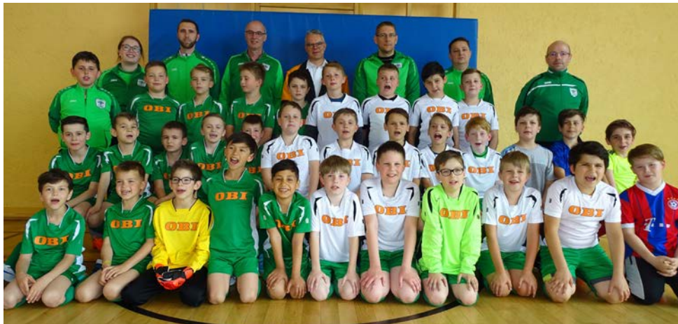
Der OBI Markt in Buchen zeigte sich großzügig und spendete den jugendlichen Fußballern des TSV Buchen zwei Trikotsätze. Dafür vielen Dank!