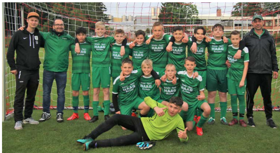
Meister nach einem spannenden Elfmeterschießen.

Die Vorrunde wurde mit neun Siegen aus neun Spielen und 47:4 Toren als Herbstmeister der Staffel 1 beendet. Nun ging es in die Hallensaison, in der es zwei Gruppenrunden gab, die beide als Erster beendet wurden. Als nächstes stand das Finale an, welches wir auch gewinnen konnten und so mit 34:5 Toren an drei Spieltagen Hallenkreismeister wurden! Jetzt ging es zur Badischen Meisterschaft nach Ketsch, bei der der Fußballkreis Buchen meist die hinteren Plätze belegt. Im ersten Spiel hieß der Gegner SV Sandhausen, der mit 3:1 besiegt wurde. Daraufhin wurde ein Spiel wegen Überheblichkeit unsererseits gegen Hilsbach verloren. Dann ging es gegen Neckarelz, die auch wieder geschlagen wurden. Auch das letzte Gruppenspiel gegen Mannheim/Vogelstang wurde gewonnen. Somit zog der TSV Buchen als Gruppenerster ins Halbfinale gegen Mannheim/Neckarau ein und verlor unter tosendem Applaus recht unglücklich. Trotz allem stellten wir bei dieser Meisterschaft den besten Torschützen und den besten Torwart des Turniers. Die Leistungen des TSV Buchen beobachtete auch ein Scout von Eintracht Frankfurt, der daraufhin drei unserer Spieler zu einem Probetraining nach Frankfurt einlud.