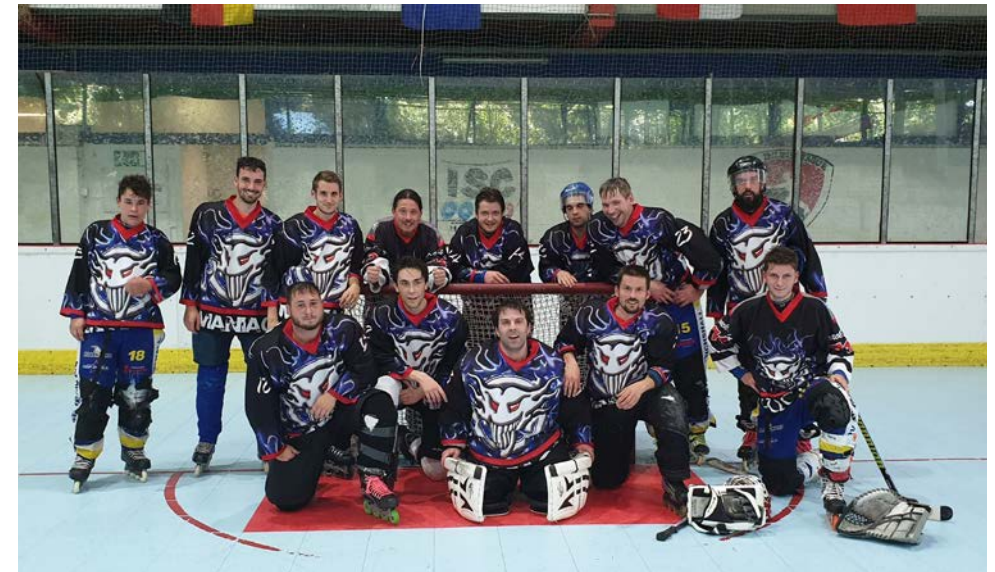
Die Buchen Maniacs

Trainer Herren: Pascal Mathes ☎ 06287 92 57 55, ☎ 0151 12 10 15 01 Trainer Jugend: Fabio Mathes, ☎ 06281 17 63 Mario Mathes, ☎ 06281 17 63 Halle: Kreissporthalle „Sportzentrum Odenwald“ Trainingszeiten: -Maniacs Di 20:00 - 22:00 Uhr Do 20:00 - 22:00 Uhr -Jung-Maniacs Sa 09:00 - 10:30 Uhr (wöchentlich)