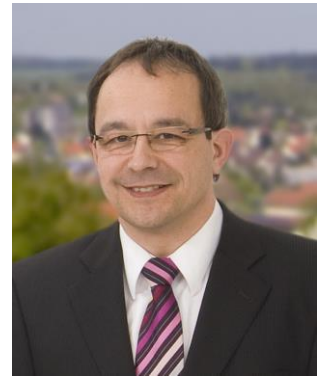
Bürgermeister Roland Burger

Die Sparte Triathlon des TSV Buchen ist am 12. Mai 2018 Ausrichter des 13. Buchener Triathlons, der in Verbindung mit dem RACEPEDIA-Cup und dem Jedermann-Triathlon / Firmencup des Baden-Württembergischen Triathlon-Verbandes stattfindet. Die Vergabe dieser Triathlon-Wettkämpfe an den TSV ist deshalb auch eine besondere Anerkennung für das engagierte Team des ausrichtenden Vereins.